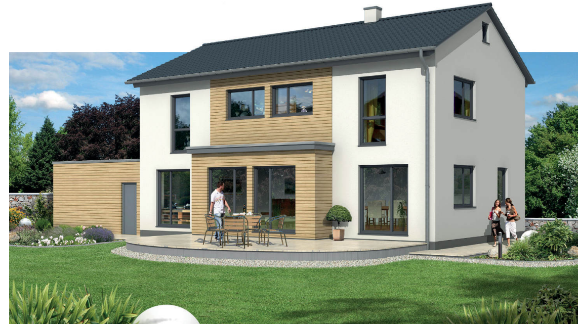
Abbildungen zeigen Sonderausstattungen