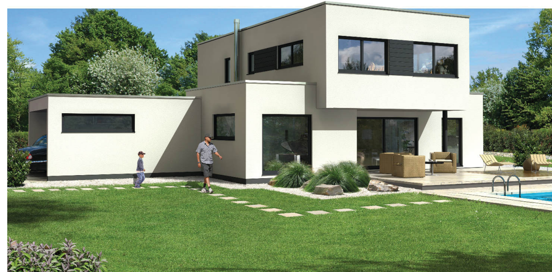
Abbildungen zeigen Sonderausstattungen

Telefon 0911-395 79 90 Telefax 0911-395 79 957 E-Mail: info@doerr-haus.de www.doerr-haus.de